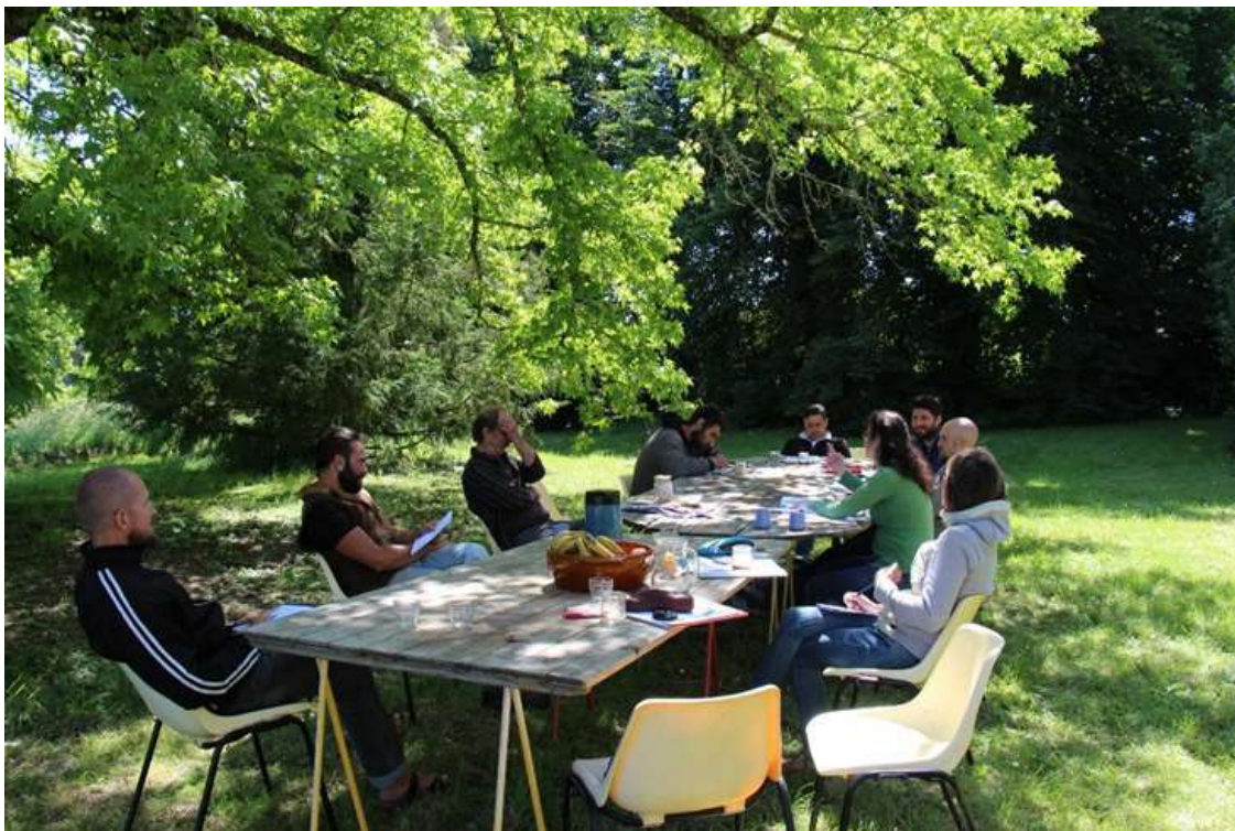
Les apprenant.es lors d'un regroupement collectif.

Sur les 8 personnes accompagnées, 3 ont trouvé leur foncier et ont commencé à préparer leurs terrains, 2 ont des opportunités de travail ou d'association avec la ferme qui les ont accueillis, et 3 personnes continuent à construire leur projet.